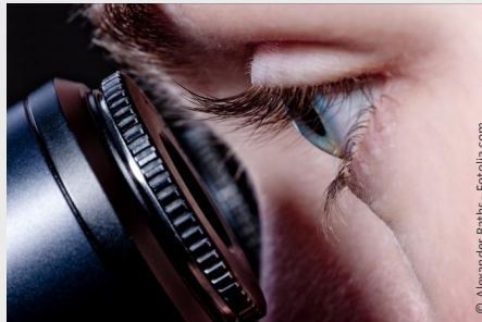
Wurzelbehandlung mit Hilfe des Mikroskops: Bis zu 25-fache Vergrößerung ermöglicht exakteres Arbeiten und bessere Ergebnisse.

Wurzelkanäle sind nur wenige Zehntelmillimeter dünn. Sie können Verästelungen, Krümmungen oder Stufen haben. Mit bloßem Auge sind solche Feinheiten nicht erkennbar. Deshalb werden sie leider oft übersehen.