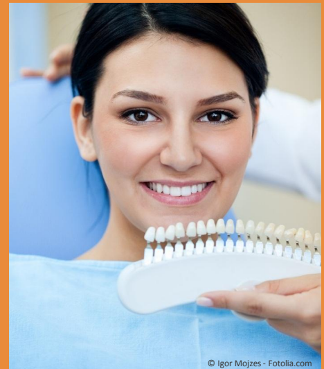
Bleaching vom Zahnarzt: Gewinnendes Lächeln mit strahlend weißen Zähnen

Dunkle Zähne können ein ziemliches Ärgernis sein: Obwohl sie sauber geputzt sind, wirken sie einfach nicht hell. Die Folge ist: Man traut sich oft nicht mehr, unbefangen zu reden und zu lächeln. Man achtet darauf, dass andere die Zähne nicht sehen. Und wenn man fotografiert wird, lässt man den Mund lieber zu. Das muss nicht sein: Zähne können heute mit bewährten Methoden wieder aufgehellt werden. Professionelles Bleaching beim Zahnarzt kostet nur wenige Hundert Euro. Aber das neue Lebensgefühl ist unbezahlbar!