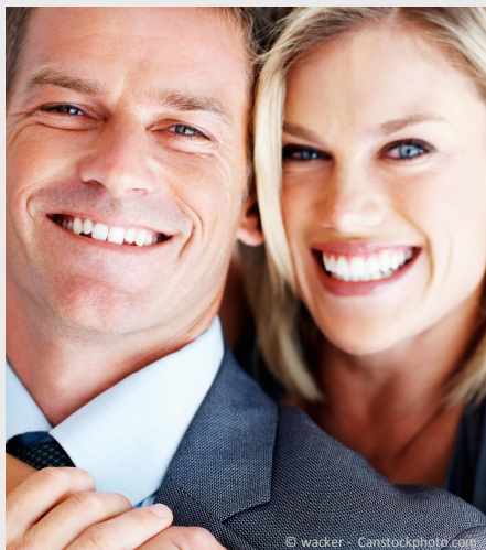
Selbstsicher mit gepflegten Zähnen

Dann werden Mund, Zähne und Zahnfleisch untersucht. Die Zahnbeläge werden angefärbt, um sie besser sichtbar zu machen und es wird die Tiefe der Zahnfleischtaschen gemessen.